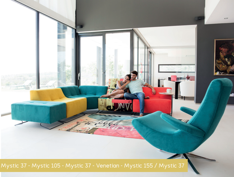
Mystic 37 - Mystic 105 - Mystic 37 - Venetian - Mystic 155 / Mystic 37