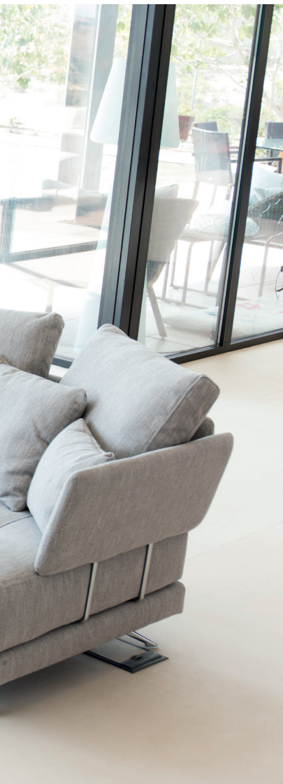
Club 12 Salonga 20 Maui 20