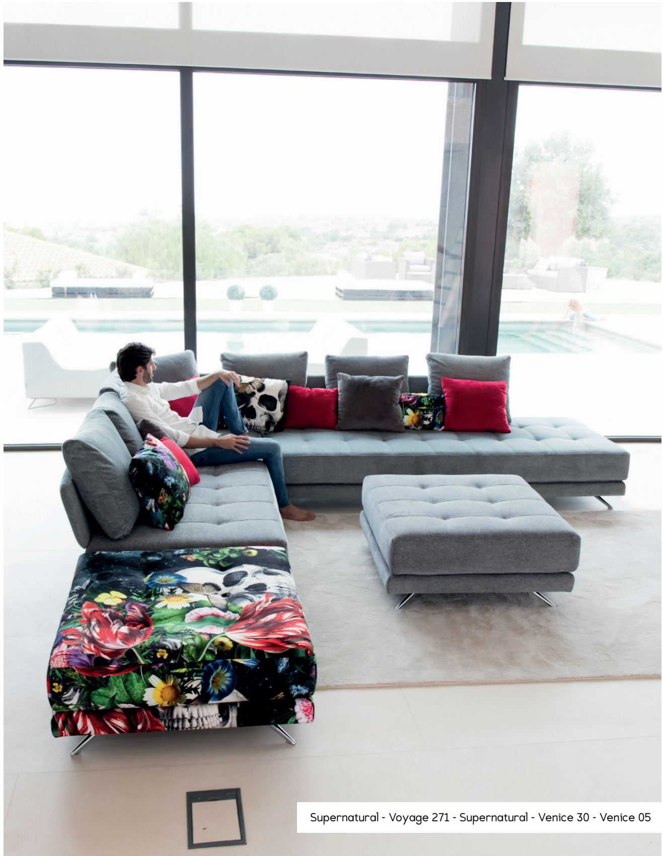
Supernatural - Voyage 271 - Supernatural - Venice 30 - Venice 05