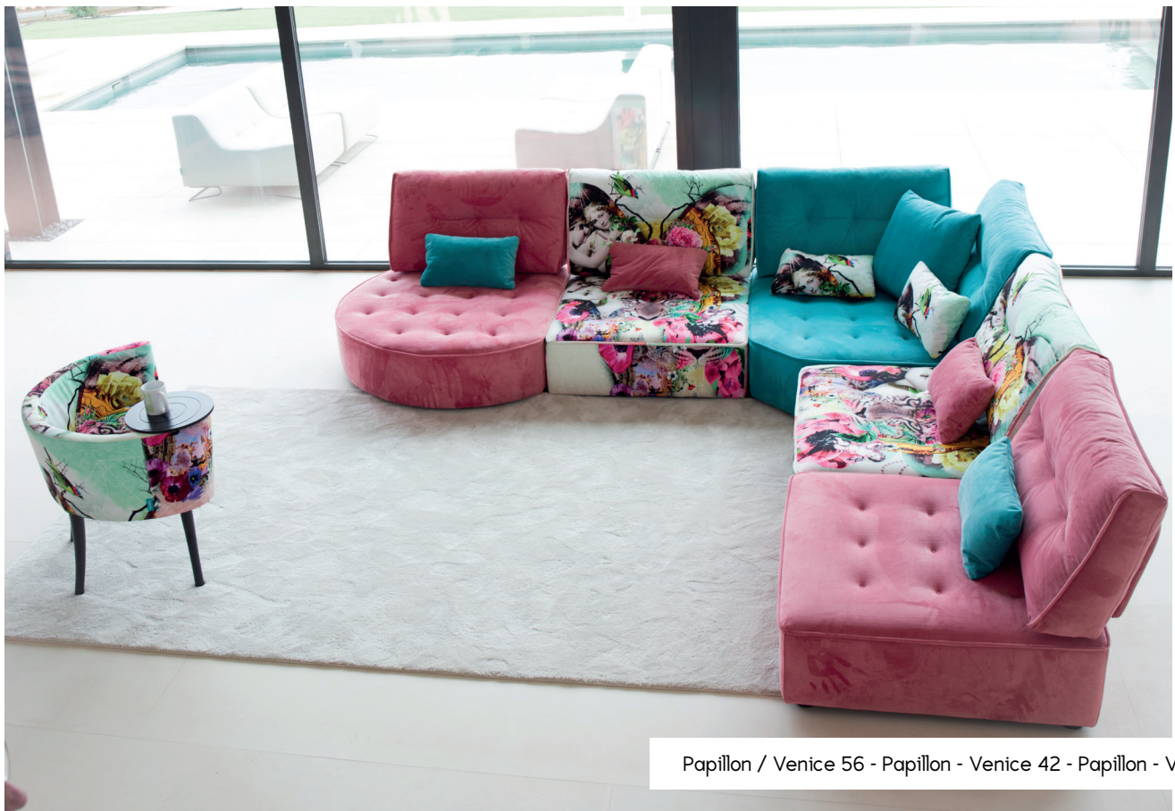
Papillon / Venice 56 - Papillon - Venice 42 - Papillon - Venice 56