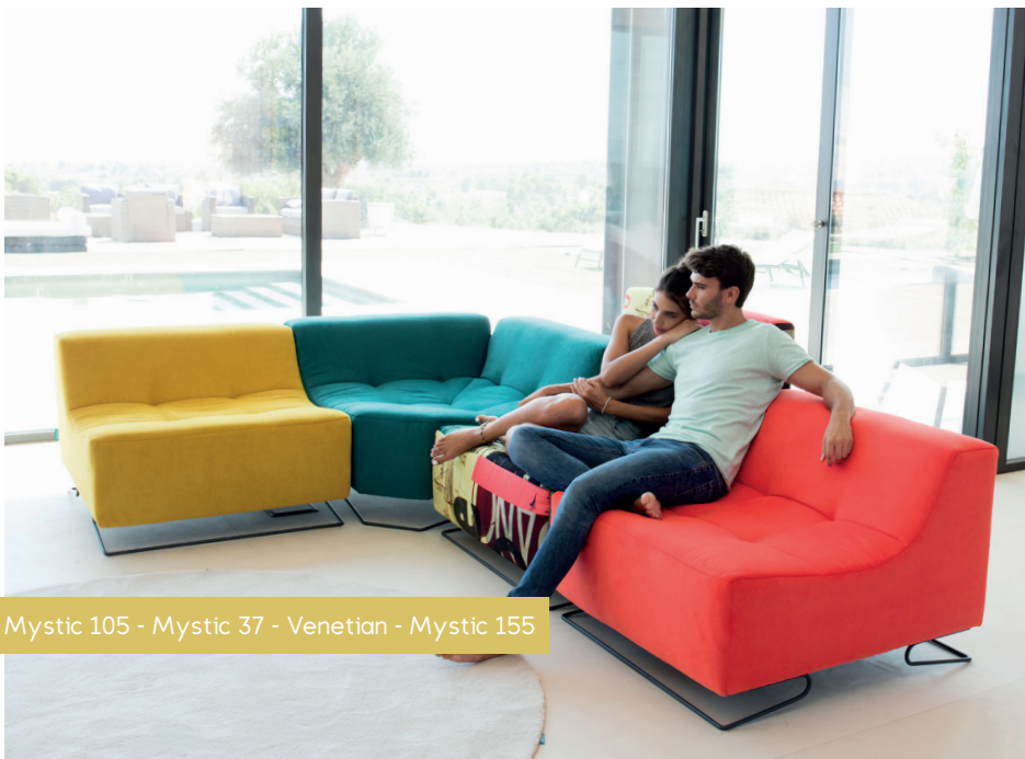
Mystic 105 - Mystic 37 - Venetian - Mystic 155