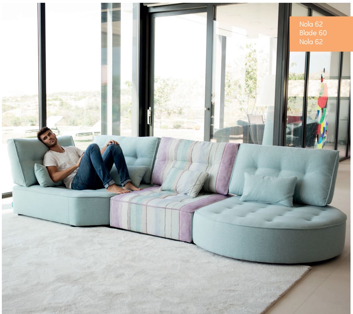
Nola 62 Blade 60 Nola 62