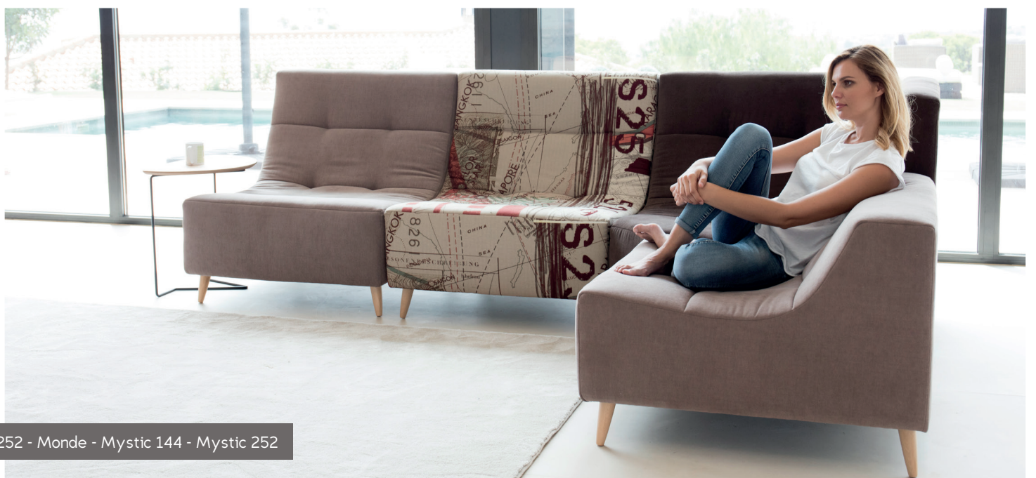
Mystic 252 - Monde - Mystic 144 - Mystic 252