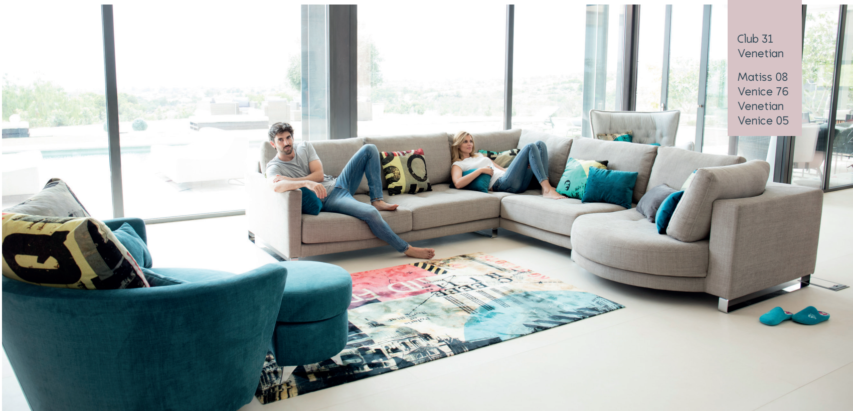
Club 31 Venetian Matisse 08 Venice 76 Venetian Venice 05