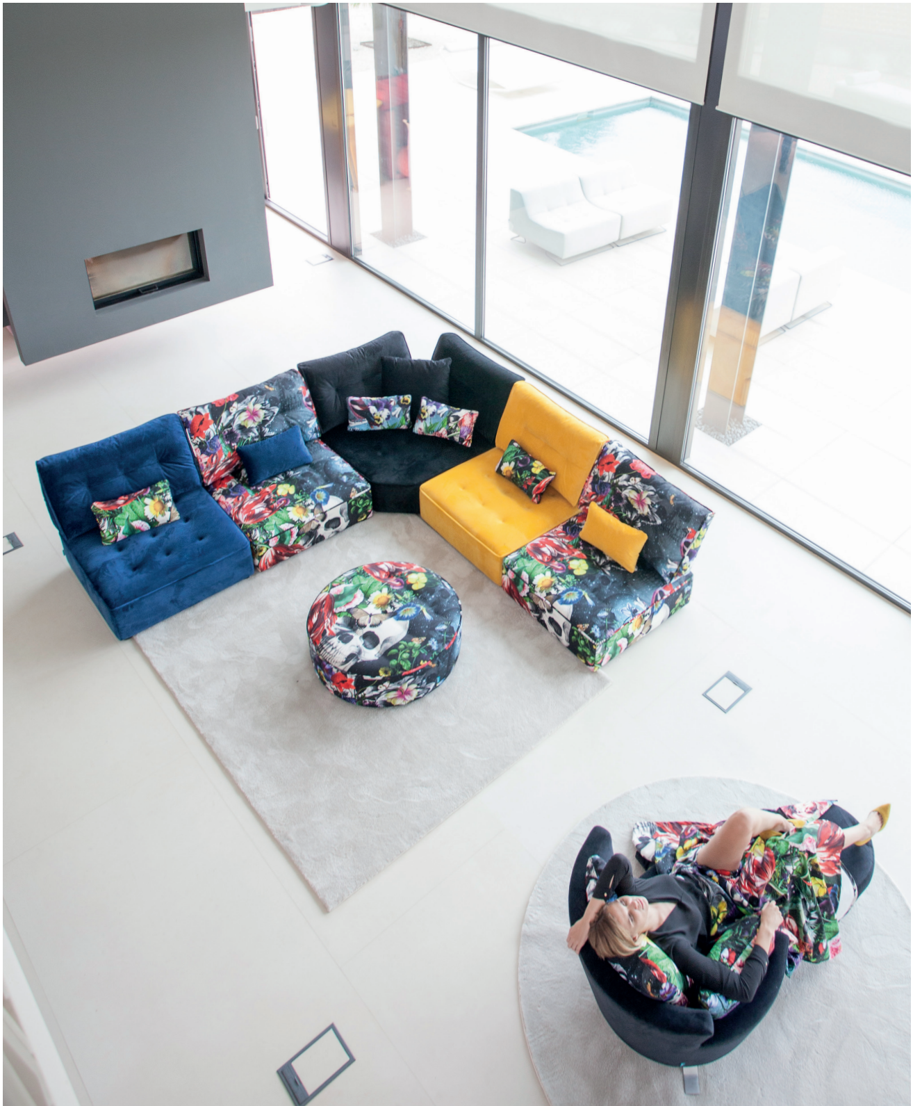
Venice 29 - Supernatural - Venice 32 - Venice 43 - Supernatural / Supernatural / Club 55 - Supernatural