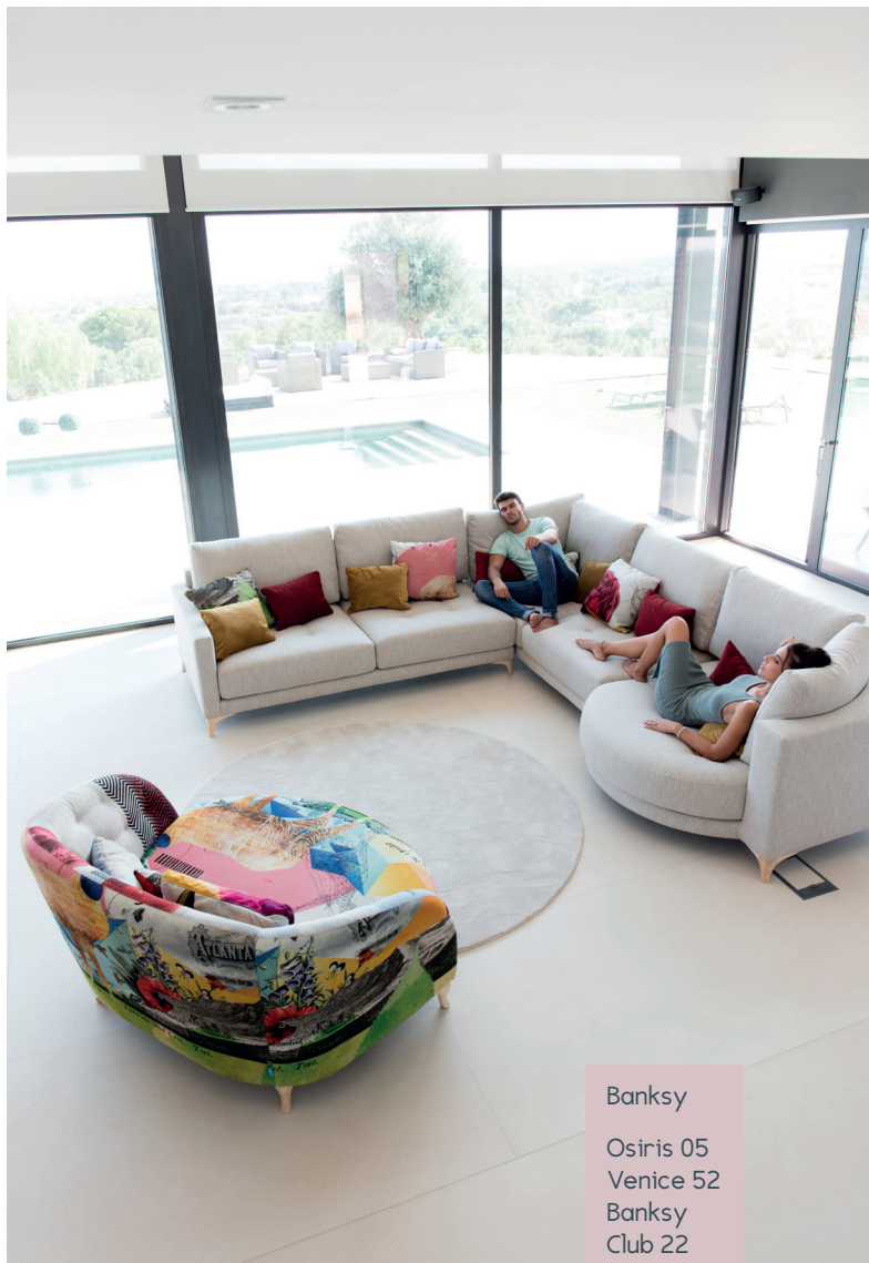
Banksy Osiris 05 Venice 52 Banksy Club 22