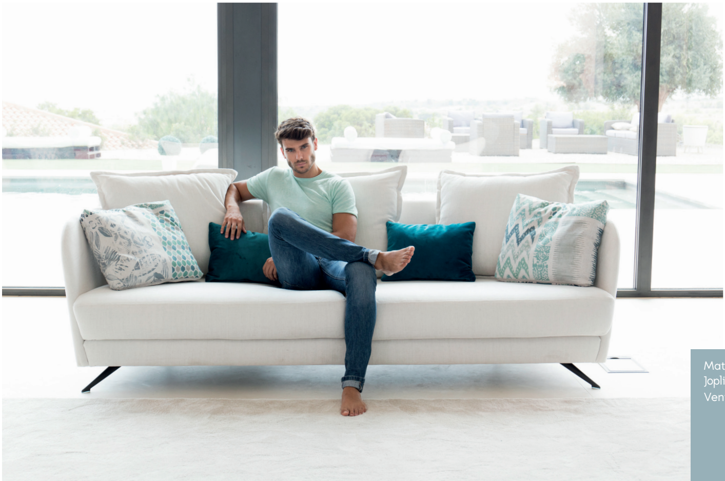
Matiss 05 Joplin 54 Venice 27