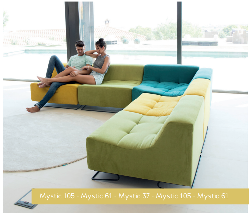
Mystic 105 - Mystic 61 - Mystic 37 - Mystic 105 - Mystic 61