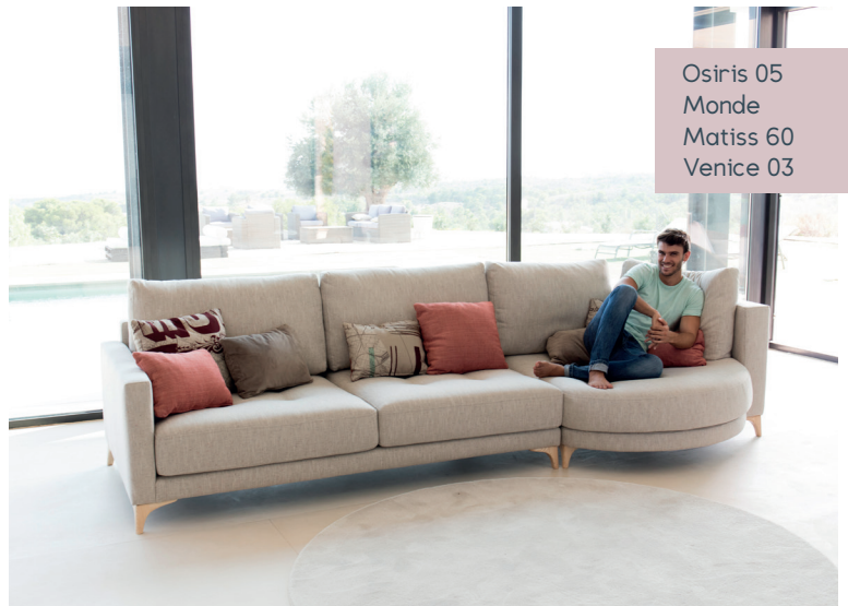
Osiris 05 Monde Matisse 60 Venice 03