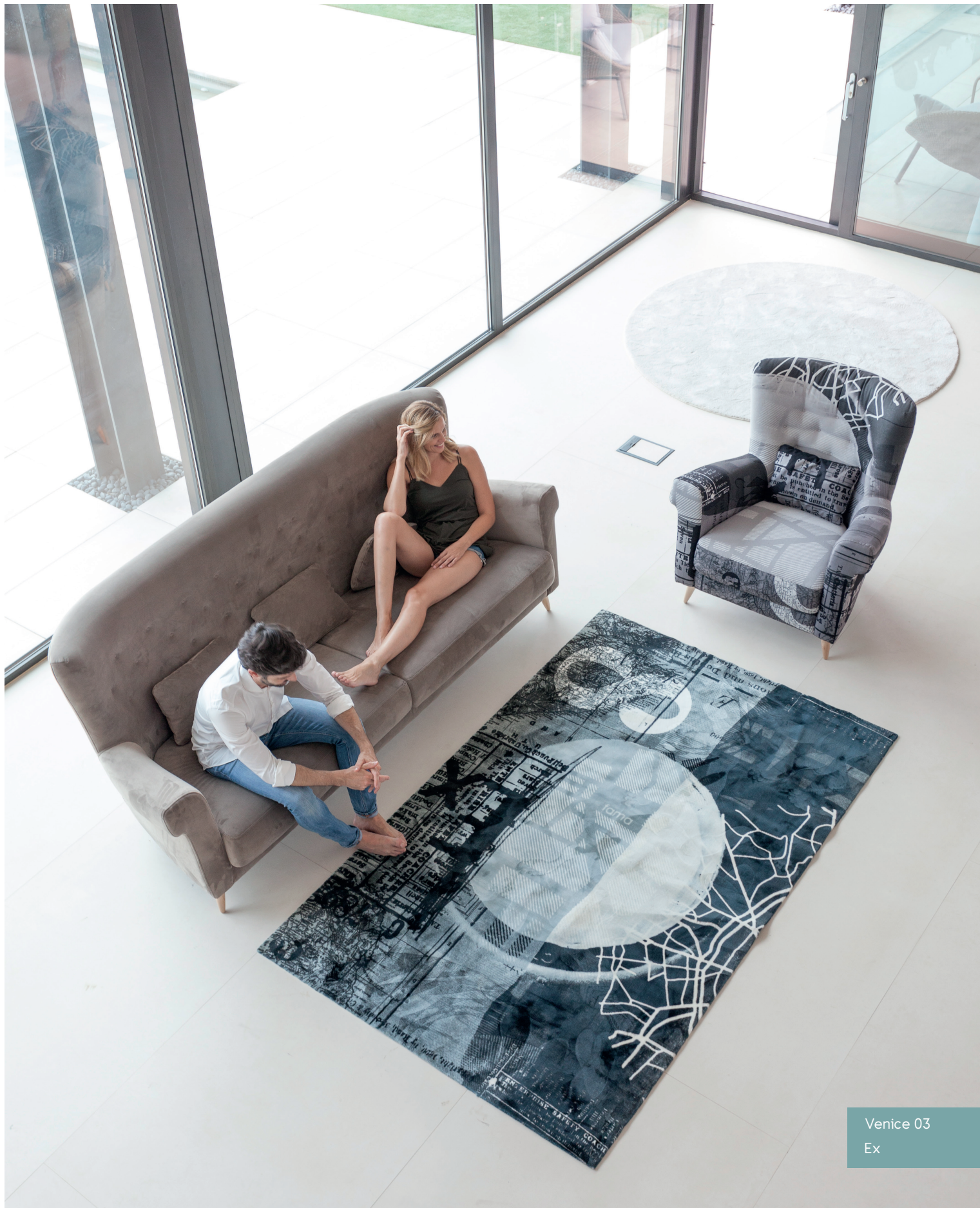
Venice 03 Ex