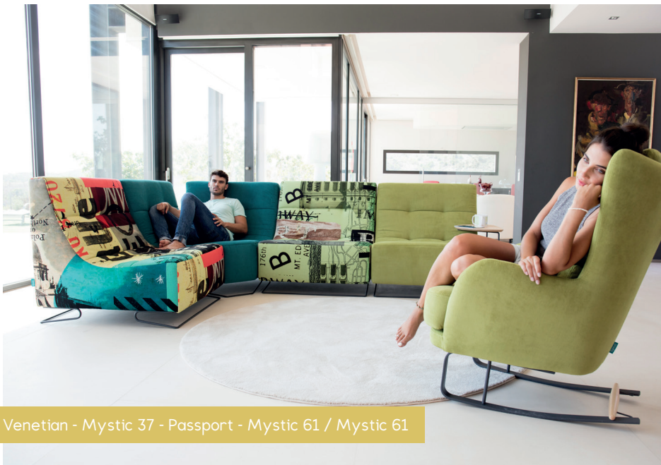
Venetian - Mystic 37 - Passport - Mystic 61 / Mystic 61