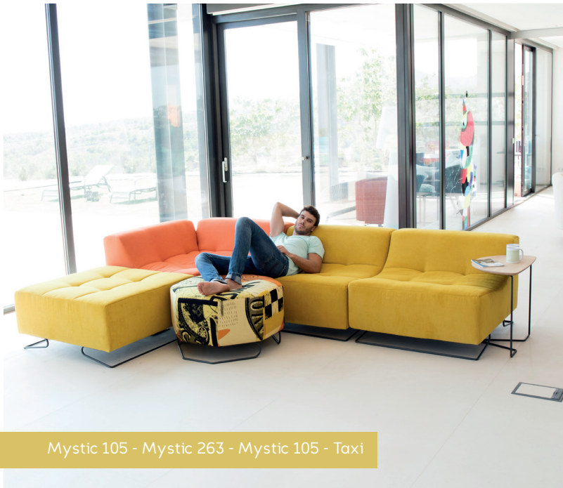
Mystic 105 - Mystic 263 - Mystic 105 - Taxi