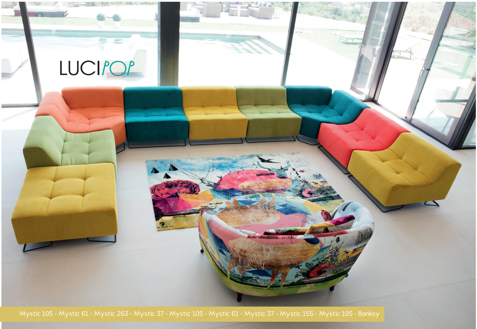
Mystic 105 - Mystic 61 - Mystic 263 - Mystic 37 - Mystic 105 - Mystic 61 - Mystic 37 - Mystic 155 - Mystic 105 - Banksy