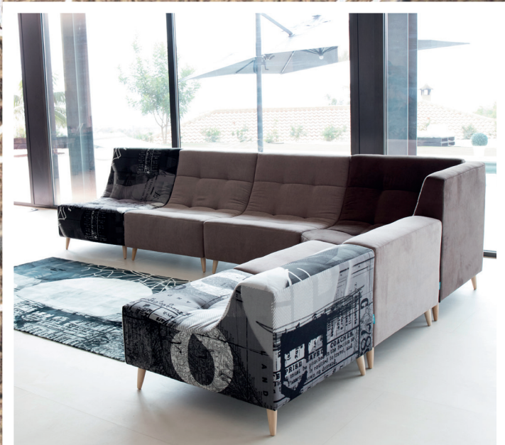
Ex - Mystic 252 - Mystic 144 - Mystic 252 - Ex