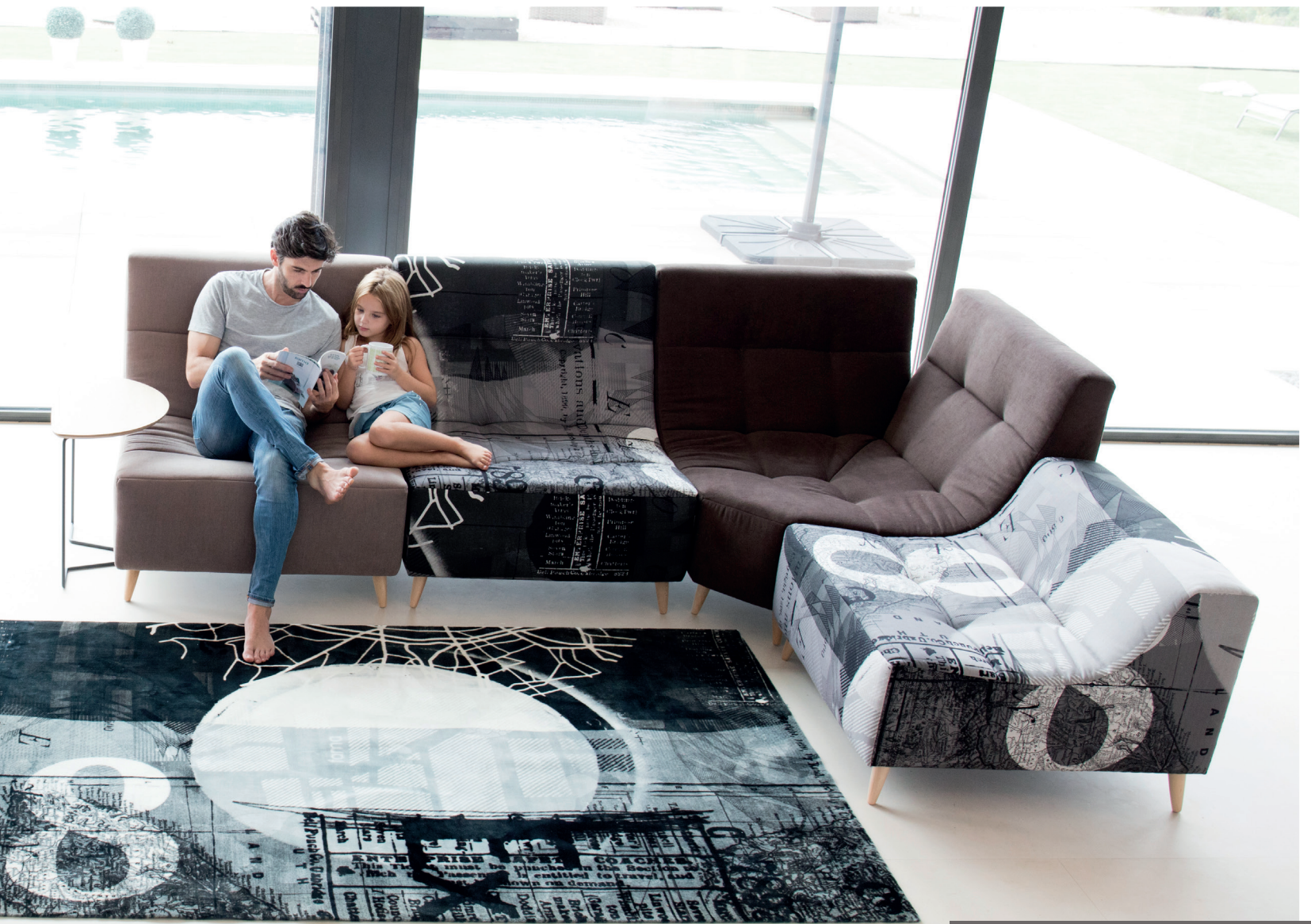
Ex / Mystic 252 - Ex - Mystic 144 - Ex