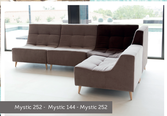
Mystic 252 - Mystic 144 - Mystic 252