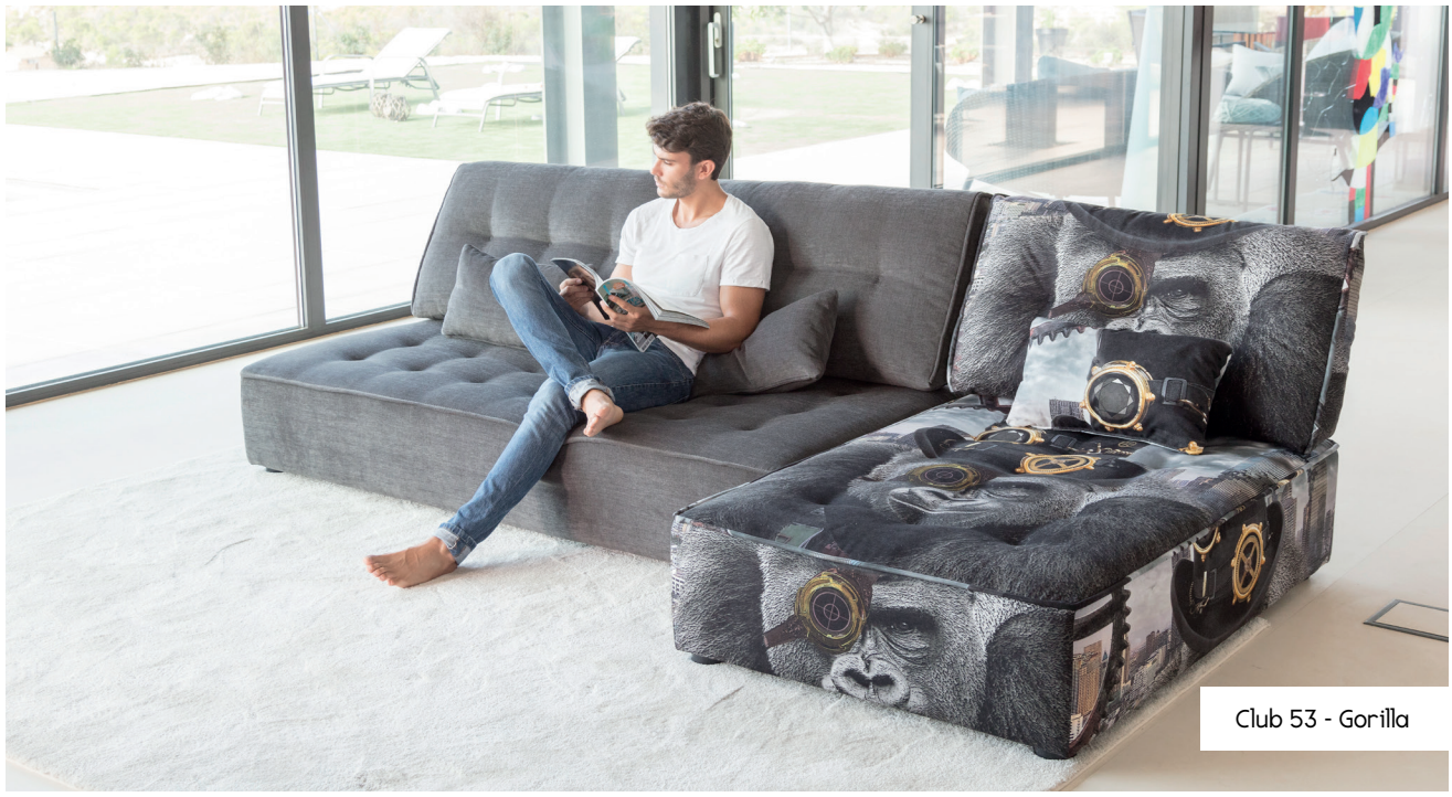
Club 53 - Gorilla