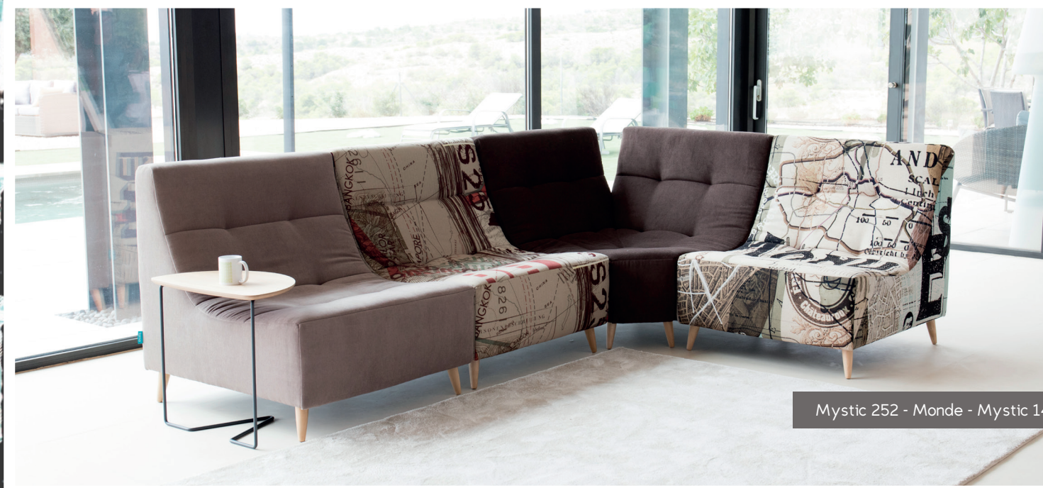
Mystic 252 - Monde - Mystic 144 - Maps