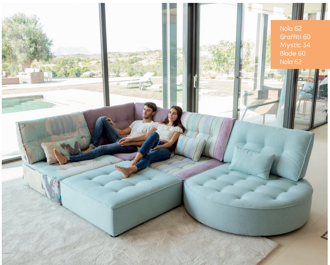
Nola 62 Graffiti 60 Mystic 34 Blade 60 Nola 62