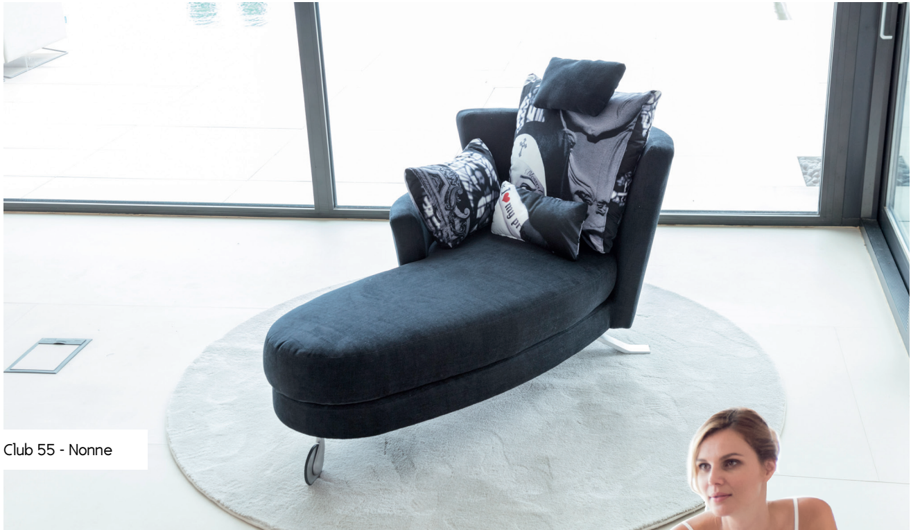
Club 55 - Nonne